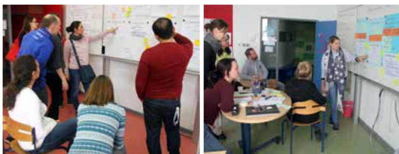
Das gesamte Kollegium, Schüler und Eltern arbeiteten in Workshops intensiv am Schulprogramm.

Miteinander im Gespräch sein und die pädagogische Arbeit einer anderen Schule kennenlernen: Aus diesen Gründen gibt es einen Austausch mit der Jianqiang Experimental School. Gegenseitig besuchten sich die Schulleitungen mit Vertretern aus weiteren Abteilungen, um einen Einblick in das schulische Wirken zu erhalten. Nach einer kurzen Vorstellung der jeweiligen Schulgeschichte, pädagogischen Ausrichtung und Schul- und Unterrichtsentwicklung besuchten die Gäste den Unterricht in der Grundschule und Sekundarstufe sowie die Gruppenarbeit im Kindergarten. Im Anschluss gab es genug Raum, sich über pädagogische Konzepte, Didaktik und Methodik auszutauschen.